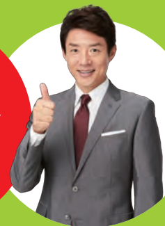
ソリマチ イメージキャラクター 松岡修造